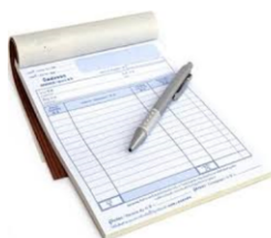
Fattura cartacea analogica

Partecipate al nostro convegno sulla fattura elettronica